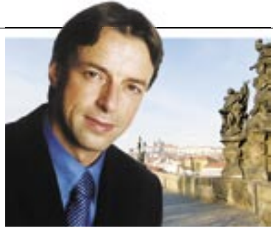
MUDr. PAVEL BÉM primátor hlavního města Prahy