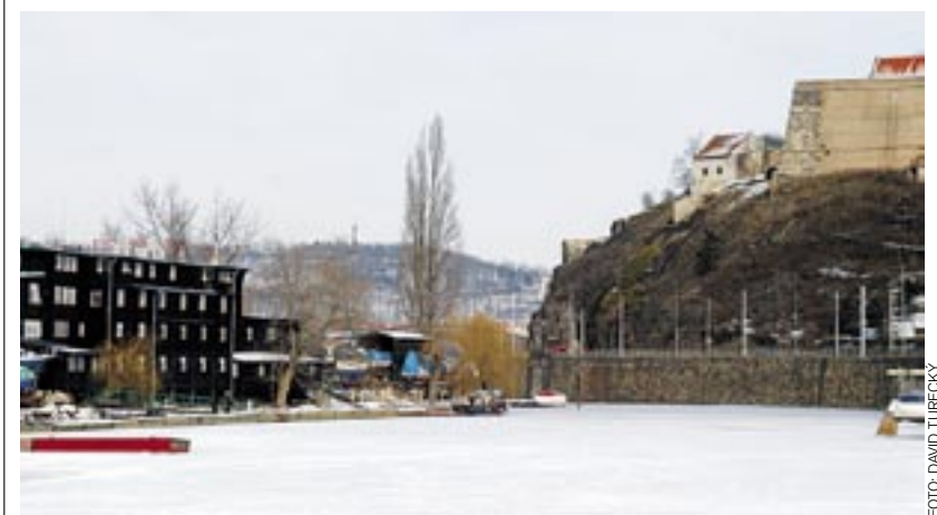
Pohled na Vyšehrad z místa, kde vznikl obraz nahoře.