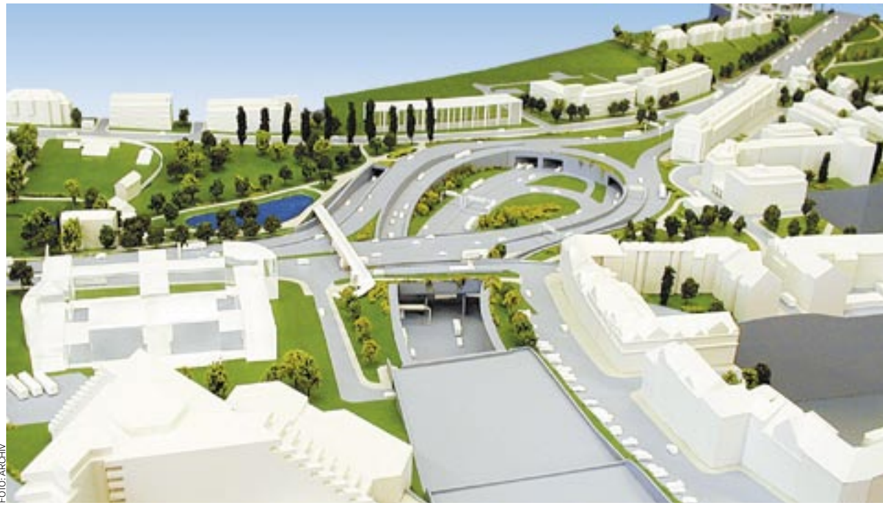
MAKETA KŘÍŽOVATKY. Z Malovanky se odstraní semafor a nahradí je mimoúrovňové křížení komunikací.

Po dokončení křižovatky na Malovance a odstranění semaforů budou vozidla mimoúrovňově rozvedena do uliční sítě Prahy 6 a 7. „Tak bude moci být využita plná kapacita celé tunelové soustavy od Zlíchovského tunelu přes tunel Mrázovka až po Strahovský tunel,“ dodává radní. Podle něj na stavbu plynule naváže výstavba severozápadní