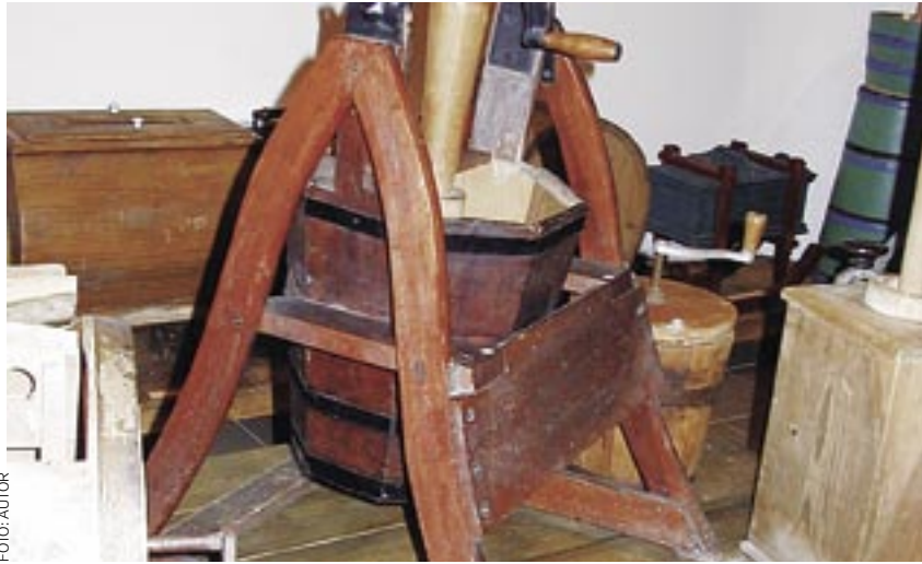
ZAJÍMAVÁ EXPOZICE. V této máselnici se tloukou podomácku máslo.