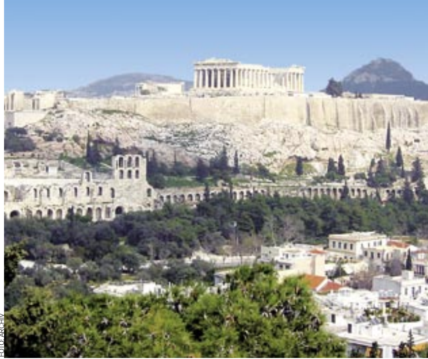
ATÉNY 2004. Stane se Praha olympijským městem v roce 2020?

Hlavní město nemá v současnosti pokryty ani základní investice v desítkách miliard na tak důležité projekty, jakými jsou čistíčka odpadních vod, městský okruh nebo další trasa metra. Považuji proto za nemyslitelné investovat zbytečně stovky miliard a nemít pokryté tyto mnohem důležitější projekty. Vedení města se však nachází ve věku stavební lobby, pro kterou představuje olympiáda obrovský byznys. Další samostatnou kapitolou jsou i obrovské náklady spojené s otázkou zabezpečení olympiády,