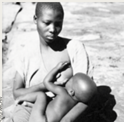
BASUTSKÁ MADONA. Fotořafováno v Jihoafrické republice 21. května 1948.

Fotografie jsou částí rozsáhlé kolekce vytvořené v roce 2003. Ta obsahuje snímky z obou slavných expedic: tedy z let 1947–1950, kdy cestovatelé s osobním vozem Tatra 87 objeli Afriku a Jižní a Střední Ameriku, a z let 1959–1964, kdy procestovali se dvěma terénními Tatrami 805 Blíž-