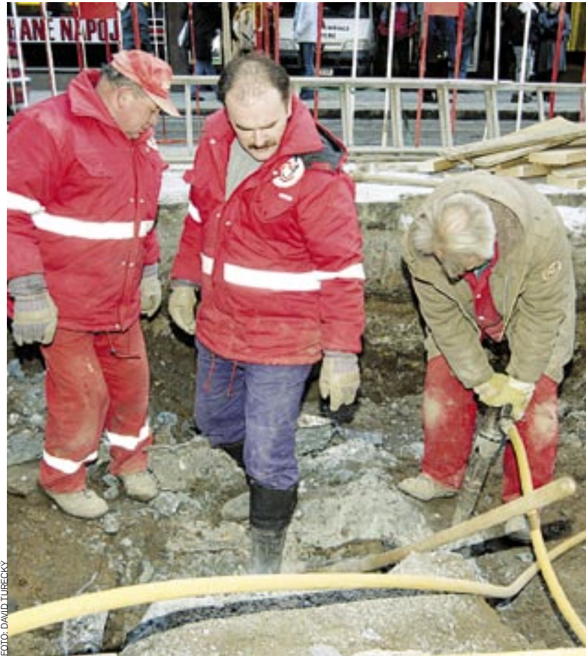
DÍRA MIZÍ. Dělníci zacelují otvor vzniklý před měsícem při havárii vody ve Vodičkově ulici v Praze 1

V současné době se pod Prahou nachází 90 kilometrů kolektorových tunelů, v nichž vedou vodovodní a plynové sítě či rozvody kabelů. Průměrná hloubka uložení kolektorů je 20 metrů, v nehlubším