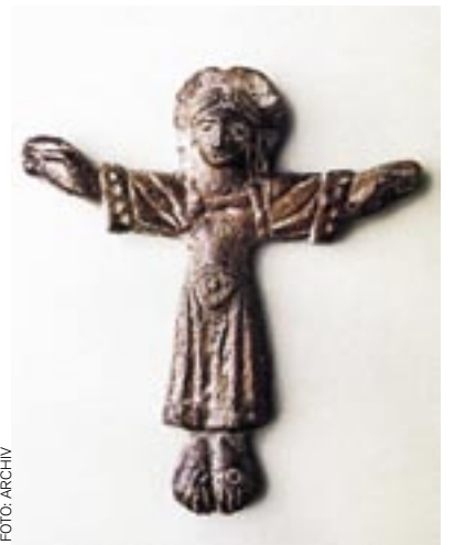
UKŘIŽOVANÝ KRISTUS. Nález z Pražského hradu, kol. r. 1000

Tento vývoj českého státu se odrazil též v růstu a poté i v poklesu prosperity jeho pražského centra. V průběhu 10. století se Praha stala jedním z nedůležitějších politických i hospodářských středisek střední Evropy. Přispěla k tomu asi především skutečnost, že podunajský dálkový obchod, přerušovaný vpádem kočovných Maďarů, si nalezl náhradní cestu z Řezna přes Prahu, Vratislav a Krakov do Pobaltí, Skandinávie i do krajin Rusů a Chazarů. Cesta procházela z převážné části územím českého státu a přinesla sem rozkvět, z něhož těžila především Praha. Stejně tak Praze prospívalo trvalé úsilí Přemyslovců o vnitřní centralizaci Čech, která zvětšovala politicko-správní význam Pražského hradu i dosah ekonomického a tržního působení jeho podhradí. Když kníže Boleslav I., vzдор své