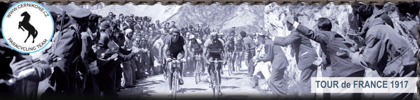
TOUR de FRANCE 1917