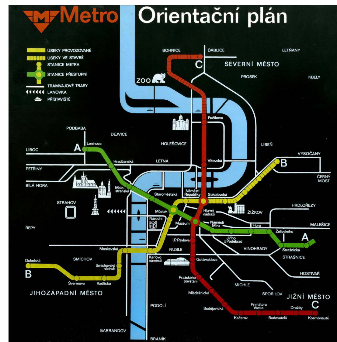
mapy a navigační prvky