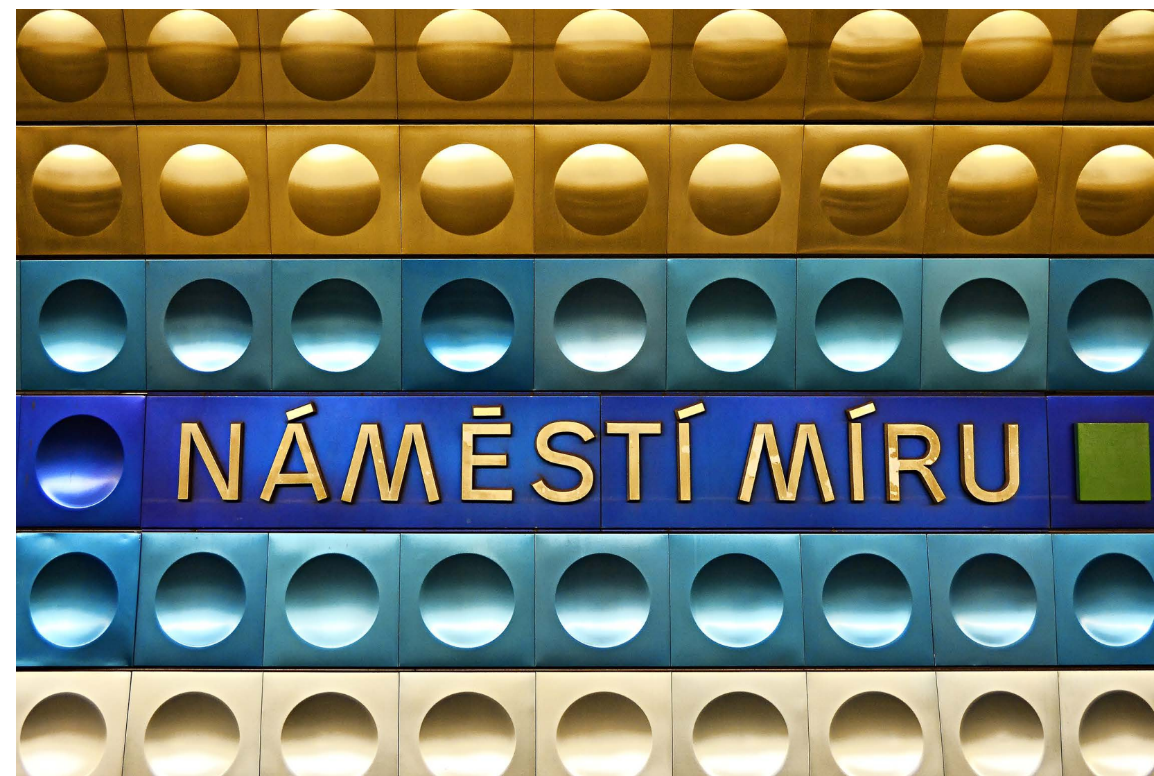
či označení zastávek veřejné dopravy