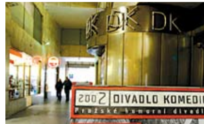
DIVADLO KOMEDIE spadá do první etapy transformace.

Další kroky by se měly po dokončení náročné rekonstrukce týkat Hudebního divadla v Karlíně, Divadla na Vinohradech a divadel pro dětského diváka. K těmto dětským divadlům