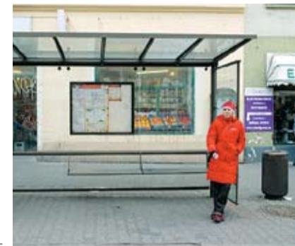
JASNÉ PORUŠENÍ zákona. Strážníci by ho řešili pokutou podle situace na zastávce.

je ale podle kritiků zákona jeho tolerance ke kouření v restauracích. „Tam je velmi šalamounsky řečeno, že se kouřit smí mimo dobu oběda. Když ale přijdu na oběd ve tři hodiny, nemůže s přítomnými kuřáky ani vrchní udělat nic,“ potvrdil L. Klema. Nekuřákům tak nezbyvá než navštívit některý z mála podniků, kde se nekouří, anebo restauraci, která je alespoň zčásti nekuřácká.