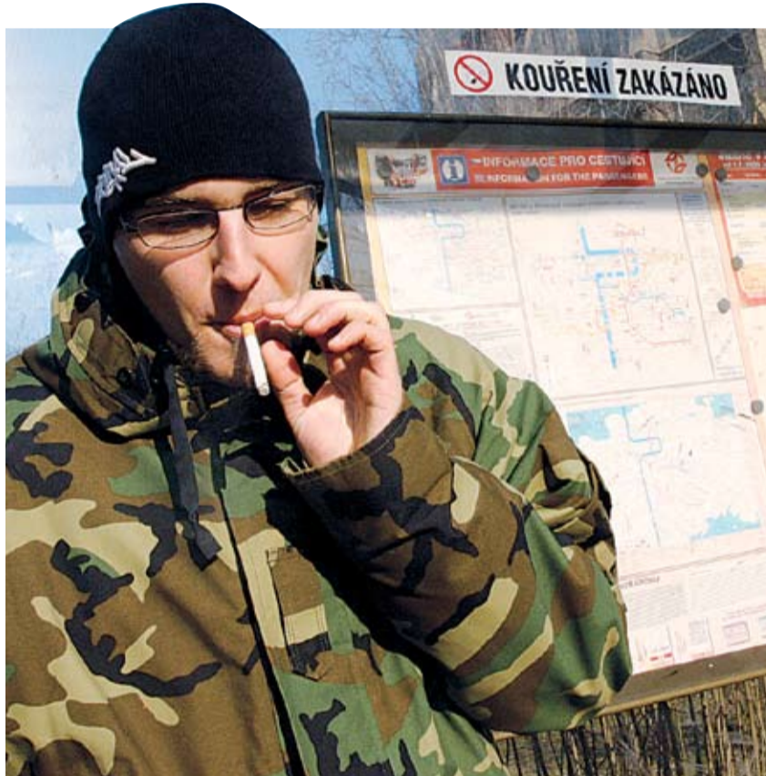
KUŘÁCI to od Nového roku v Praze už nemají tak jednoduché.

Protikuřácký zákon, který začal platit na Nový rok 2006, zakazuje kouření na řadě veřejných prostranstvích. „Kouřit se od letoška nesmí v nemocnicích, ve školách, v kinech a divadlech, ve sportovních halách, na státních úřadech, na nástupištích a zastávkách veřejné hromadné dopravy a na dalších veřejně přístupných místech,“ vysvětlil náměstek primátora Rudolf Blažek. I v kině a divadle je ovšem možné si zapálit ve vyhrazených prostorách. Podobně pak v restauraci, pouze však v prostorách, které budou striktně vymezeny pro kuřáky. Zákon přesně stanoví, že kouření je povoleno pouze v zařízeních, která mají zvláštní prostory vyhrazené pro kuřáky a která jsou označena zjevně viditelným nápisem Prostor vyhrazený pro kouření anebo jiným obdobným způsobem. Až do konce roku 2005 milovníci nikotinu v restauracích v době podávání hlavních jídel kouřit nesměli vůbec.