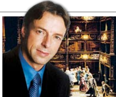
MUDr. PAVEL BÉM primátor hlavního města Prahy