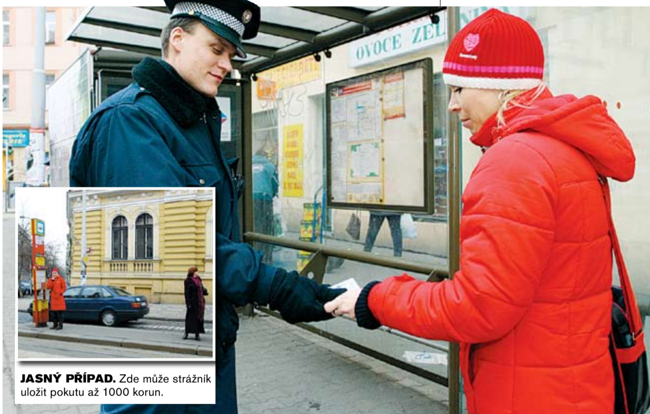
JASNÝ PŘÍPAD. Zde může strážník uložit pokutu až 1000 korun.

Takřka denně dochází v rámci hlídkové činnosti strážníků k porušování protikuřáckého zákona po celé metropoli. Omezení kuřáků na zastávkách MHD je také často předmětem malicherných sporů. „Je to hloupost, stojím na chodníku, na tramvaj nečekám,“ stěžuje si muž, když jej na náměstí Míru kontroluje dvojice strážníků. Ti jej nakonec požádají, aby se vzdálil od skupinky čekajících, a odchází. „Formulace o zákazu kouření na zastávkách je v zákoně poněkud nešťastná,“ potvrzuje Ludvík Klema, náměstek ředitele Městské policie Praha. Zhruba na třetině pražských tramvajových či autobusových zastávek totiž nelze prostor, kde má zákon platit, v podstatě nijak jasně vymezit. „Co se týče délky, je to poměrně jasné. Zastávka je vymezena stojanem s jízdními řády na straně jedné