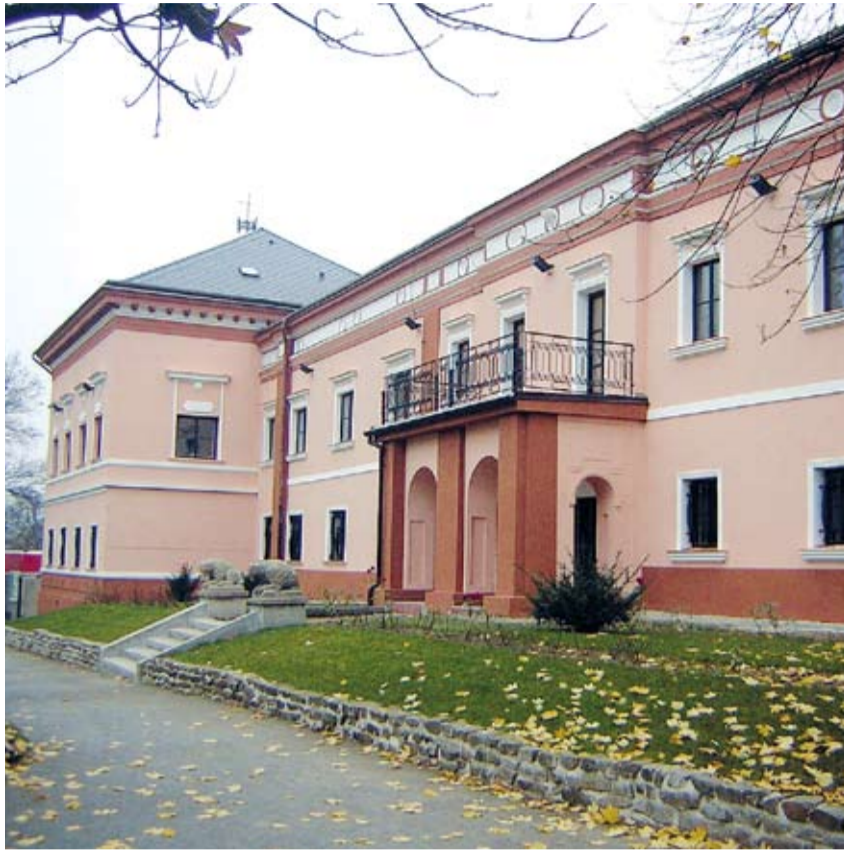
ČAKOVICKÝ ZÁMEK slouží po rekonstrukci školství.

Posledním majitelem zámku byl baron von Schoeller, kterému byl zámek zkonfiskován na základě tzv. Benešových dekretů po 2. světové válce. Od té doby se v něm vystřídalo mnoho uživatelů od vojenských