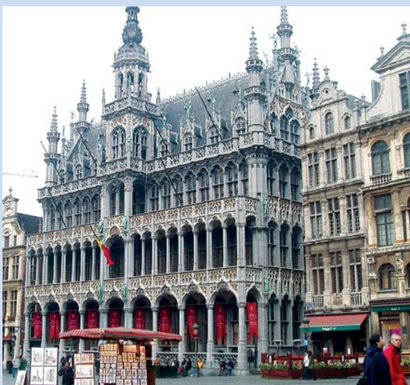
BRUSELSKÁ RADNICE na historickém náměstí Grand Place patří k turistickým lákadlům belgické metropole.

Stačí však vejít do některého z mnoha rozlehlých bruselských parků, které lemují a protkávají celé město, a dáte belgické metropoli druhou šanci. Najdete zde klid, pohodu a usměvavé, vstřícné lidi. Zeptáte-li se kteréhokoliv kolemjdoucího, ochotně vám plynou angličtinou poradí nejen cestu, ale třeba i tip na příjemnou hospůdku v blízkém okolí. Bruselská pohostinská zařízení jsou vyhlášena výběrem z několika desítek druhů pív a především vybranou gastronomií. Ani znalci se neshodnou, zda za vyni-