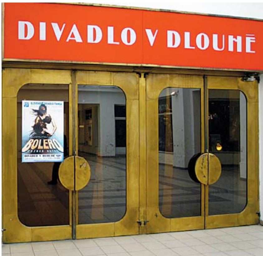
DIVADLO v Dlouhé se v budoucnu změní do podoby obecně prospěšné společnosti.

V současnosti je připravována II. etapa transformace divadel zřizovaných hl. m. Prahou – Divadla na Zábřehu, Divadla v Dlouhé,