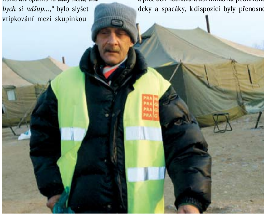
PRAŽSKÝ MAGISTRÁT zřídil na Letné dočasné stanové útočiště pro bezdomovce.

ukázaly jako zbytečné. Také různé zvěsti o nedostatečné hygieně či „řídce“ polévce byly přehnané. „...no jo, Ambassador to není, ale špatné to taky není, dal bych si nášup...“ bylo slyšet vtipkování mezi skupinkou