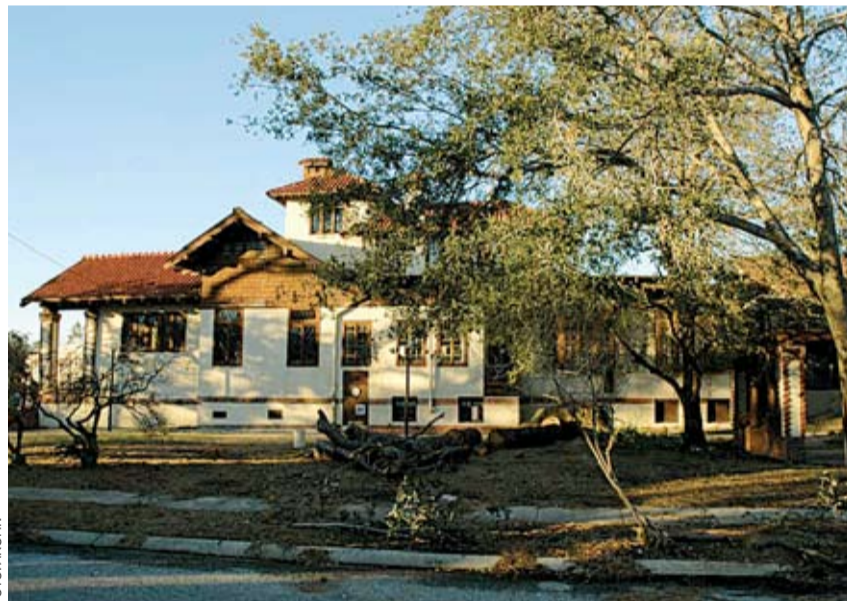
MĚSTSKÁ KNIHOVNA v New Orleans čeká na pomoc Prahy.