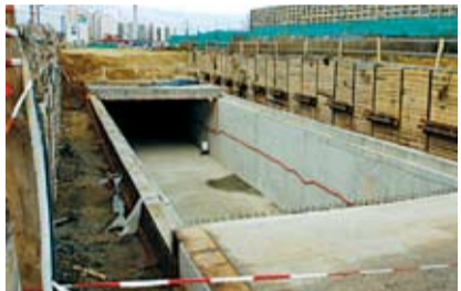
STAVBA METRA trasy C4 pokračuje podle plánu

Původní rozpočet hlavního města Prahy pro loňský rok, který zastupitelé schválili na konci prosince 2004, počítal s výdaji vyššími o zhruba 12,3 miliardy korun než příjmy. Nejvyšší ztrátovou položku v něm představovaly náklady na školství, tj. dočasné nahrazení dotací z ministerstva školství ve výši přesahu-