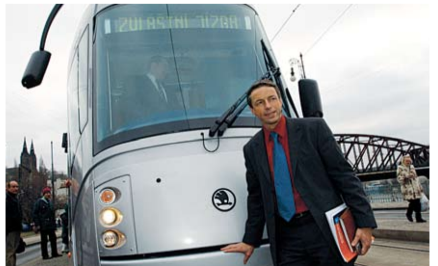
VZHLED nové tramvaje si se zájmem prohlédl i pražský primátor Pavel Bém.

Nový model má před sebou ještě několik měsíců zkušební provozu, část už i s cestujícími – pravděpodobně ještě v prvním čtvrtletí letošního roku. Letos také tento nový typ tramvaje s označením T14 získá další sourozence, takže do konce roku by měl mít Dopravní podnik hl. m. Prahy celkem 12 těchto moderních vozů. Cena jedné tramvaje se pohybuje kolem 60 mil. korun, což je podle radního Šteinera o deset až dvacet procent méně než cena běžná u zahraničních výrobců. Smlouva je podepsána na 20 vozů, v letech 2007–2009 by mělo být dodáno patnáct tramvajů a v roce 2010 ještě tři.