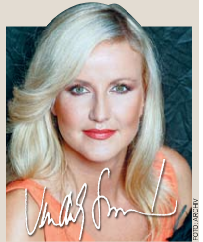
CELEBRITA roku Vendula Svobodová

Nadační fond Kapka naděje, jehož vznik v roce 2000 souvisí s těžkou, bytostně prožitou zkušeností Venduly Svobodové, když její malá dcera onemocněla a bohužel prohrála dlouhý boj s těžkou formou leukémie, se vyprofiloval jako důvěryhodná a nanejvýš potřebná instituce. Podařilo se mu navázat řadu kontaktů, vzbudit zájem velkého počtu institucí a firem o dlouhodobou spolupráci a vstoupit do povědomí široké veřejnosti. Koncem loňského roku pak zvítězila v nové čtenářské a televizní anketě Top Celebrita v hlavní kategorii Žena roku 2005 a současně s manželem, skladatelem Karlem Svobodou, získali nejvíce hlasů v kategorii Pár roku 2005.