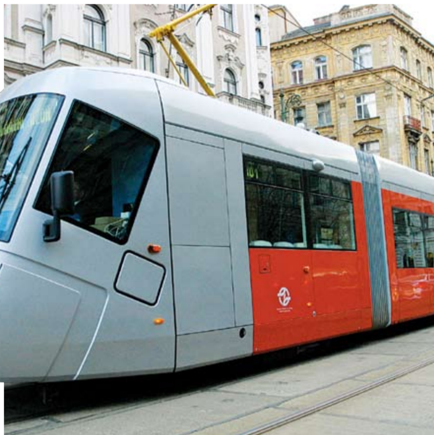
NOVÁ TRAMVAJ s pozoruhodným designem od firmy Porsche bude sloužit Pražanům už v tomto roce.

Další prioritou města je posilování bezpečnosti v ulicích metropole. „Žít s pocitem bezpečí ve městě, kde pracujeme, trávíme volný čas, kam jezdí milióny zahraničních turistů, je pro mne osobně cílem, k jehož dosažení chci využít všech prostředků, které mám v rámci svých kompetencí k dispozici,“ slibuje Rudolf Blažek, náměstek primátora pro oblast legislativy a bezpečnosti. „Pražané i návštěvníci