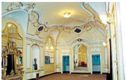
HUDEBNÍ DIVADLO v Karlíně město podpoří více než 480 milióny korun