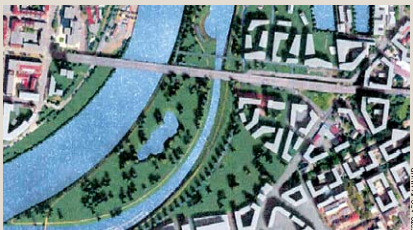
LETECKÝ POHLED na Rohanský ostrov.