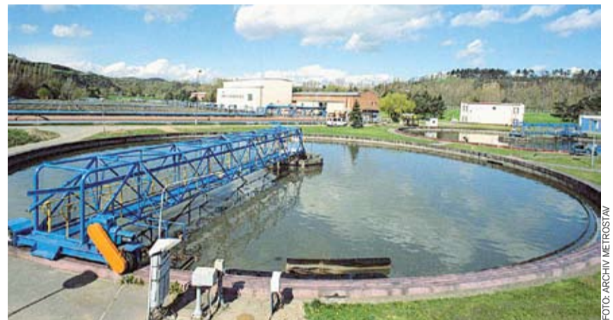
REKONSTRUKCE ústřední čistírny odpadních vod v Troji je jednou z priorit města