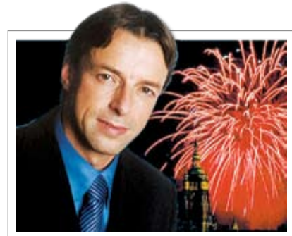
MUDr. PAVEL BÉM primátor hlavního města Prahy

Nový rok nebude jen volební, ale především pracovní