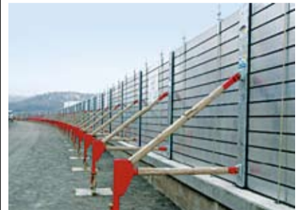
PROTIPOVODŇOVÉ ZÁBRANY v Holešovicích