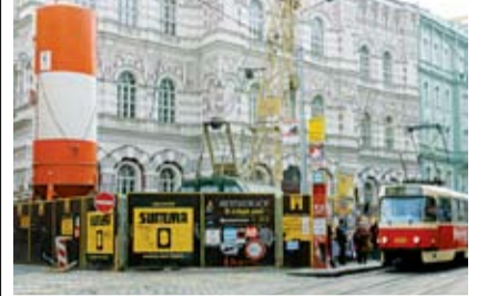
STAVBA kolektoru ve Vodičkově ulici

Největší částka z letošního rozpočtu půjde tradičně na dopravu, a to přes 15,7 miliardy korun, na výstavbu protipovodňových zábran se počítá s 940 milióny. Dalších více než půl miliardy chce město investovat do škol a za zhruba 540 miliónů korun bude pokračovat stavba kolektoru pod Vodičkovou ulicí. „Letošní rozpočet Prahy schválilo