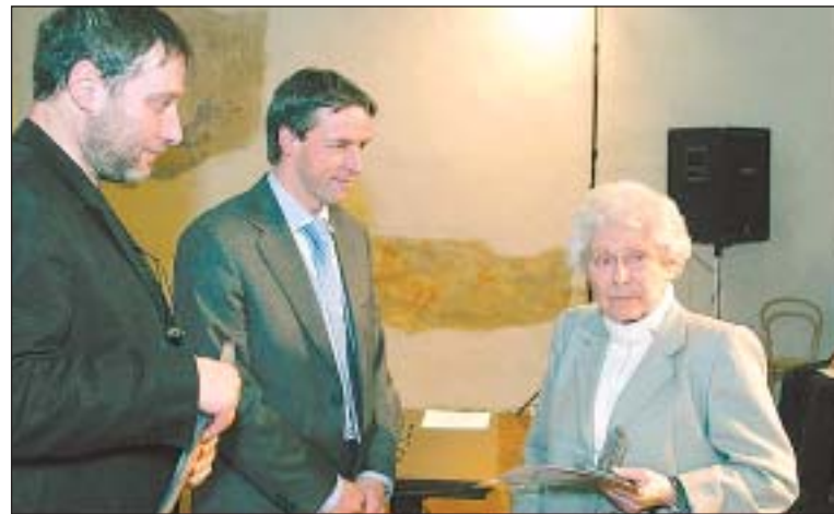
Třem desítkám dobrovolníků předávali ceny Křesadlo pražský primátor Pavel Bém a herec Tomáš Töpfer.

Cenu Křesadlo dostávají lidé, které vybrala komise z návrhů neziskových organizací i jednotlivců. Komise složená ze zástupců neziskových organizací, novinářů a zástupců města Prahy vybírala z 21 navržených dobrovolníků. Podobně je tomu i v dalších krajích a místech České republiky, například v Hradci Králové, Ústí nad Labem, Českých Budějovicích či Zlíně. (tmd)