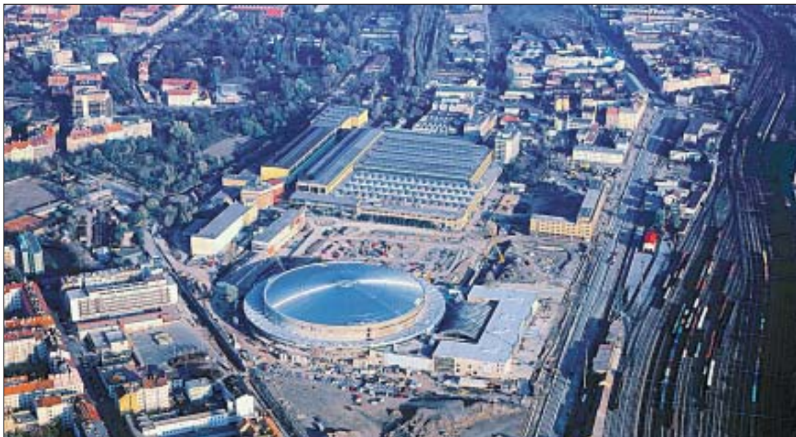
Českomoravská ulice je významná nejen pro Prahu 9, ale pro dopravní síť celého města. Ulice bude zprovozněna 26. března, o den později bude slavnostně otevřena blížká Sazka Aréna.