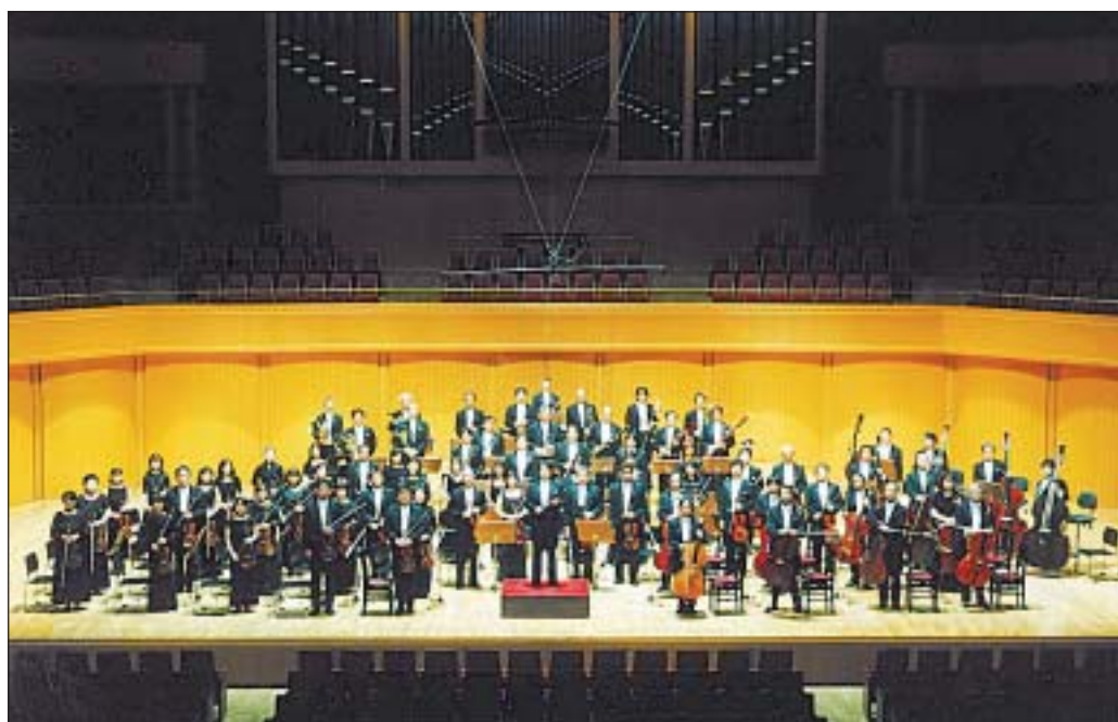
Letošní 59. ročník festivalu Pražské jaro přivítá také Nagoya Philharmonic Orchestra.