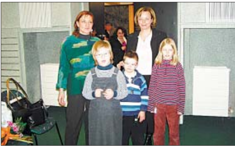
Dokument „Společně ve škole“ se snaží o začlenění dětí s mentálním postižením do společnosti.

„Během příštích dvou let se plánuje natočení v pořadí již třetího dokumentu o dětech s Downovým syndromem, který bude věnován přípravě dětí na nezávislý život. Zkrácenou verzi dokumentu „Společně ve škole“ odvysílá Česká televize koncem března v rámci pravidelného vysílání pořadů se sociální tematikou,“ dodala režisérka a scénářistka dokumentu Olga Strusková. (egr)