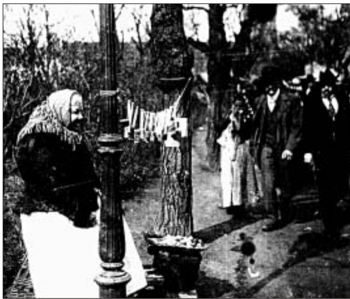
Matějská pouť nabývala vždy nejen atrakce, ale i prodej různého zboží.

Původní poutní oslavy se odehrávaly v neděli po 24. únoru v nejbližším okolí kostela, na návsi tehdejší osady Horní Šárka. Kolotoč, boudy s perníkem a nejrůznějšími tretkami, flašinetáři a spousty piva z pražských i okolních pivovarů. V místech dnešních dejvických ulic se od Písecké brány rozprostírala převážně pole a louky. Dlouhá a klikatá polní cesta ke kostelu bývala podle rozmarů