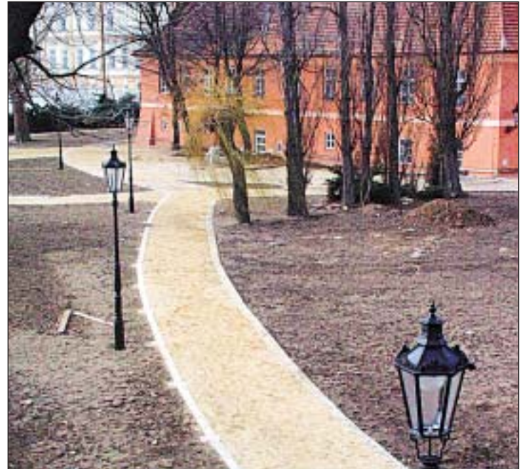
Místo ukotvení pro mobilní zábrany u Mánesova mostu.

Jedná se o projekt přesahující 19 milionů Kč. Zanedlouho bude město