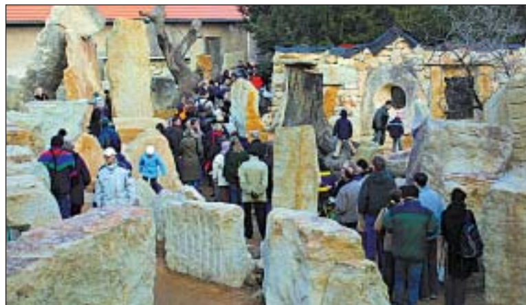
V únoru byl v ZOO otevřen Africký pavilon.

Několik málo dní po slavnostním otevření již pavilon Afrika zblízka slavil chovatelský úspěch a ošetřovatelé se dočkali radostné události – mláďete slepocinka Percivalova. Je to plaz, o kterém se ví jen málo a jehož rozmnožování ani chov v zoologických zahradách rozhodně nepatří k běžným událostem. (tmd)