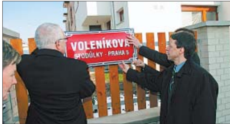
Pojmenování nové ulice se zúčastnili také prezident Václav Klaus a primátor Pavel Bém.