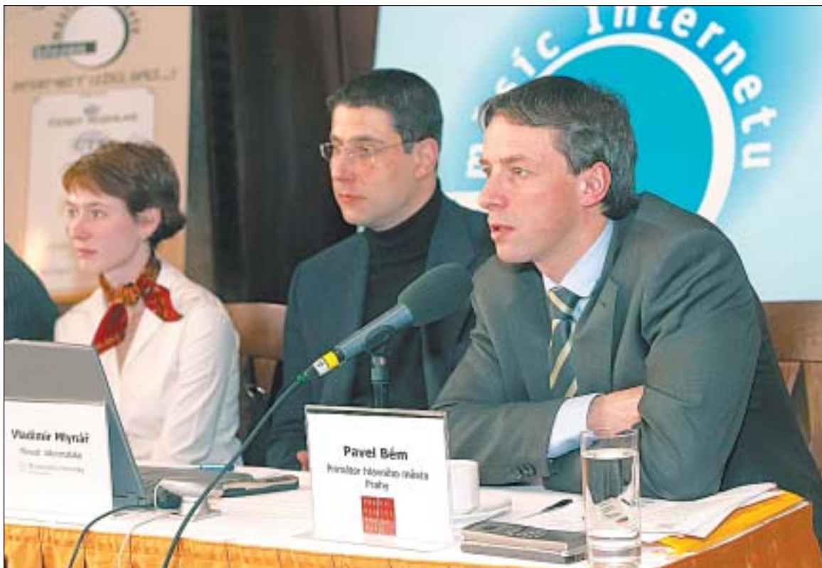
Březen – měsíc internetu je tradičním projektem na podporu rozvoje tohoto média u nás.

Tiskový servis je nedílnou součástí informací poskytovaných na webových stránkách Prahy a je cenovou komunikační cestou Magistrátu hlavního města Prahy, primátora, rady i zastupitelů směrem k Pražanům a dalším zájemcům o aktuální dění v Praze. K dispozici je denně aktualizovaná nabídka informací v rubrikách „Tiskový servis“, „Zpravodajství hlavního města Prahy“, „Napsali o nás“, „Listy hlavního města Prahy“, „Zaslání zpráv na e-mail“, „Doporučujeme“, „Útulek pro opuštěná zvířata“