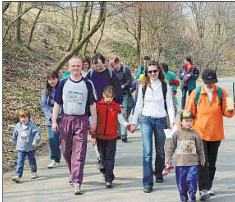
Jaro láká do přírody jak malé, tak i dospělé Pražany.