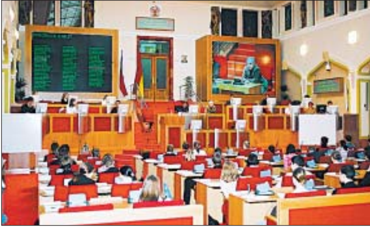
Práci pražských zastupitelů si vyzkoušeli studenti Gymnázia z Voděradské ulice v Praze 10.

Přesně v 9 hodin již mladí zástupci města seděli na svých místech a pozorně naslouchali technickým pokynům z jednacímu řádu a hlasování. Po slavnostní znělce přivítal studentské zastupitelstvo primátor hlavního města