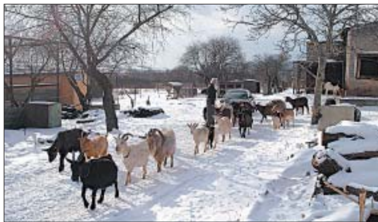
Praha pomůže jinonické stanici pro handicapované živočichy, která je v Prokopském údolí.