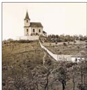
U kostela sv. Matěje se původně konala Matějská pouť.

Není známo, jak hluboko do minulosti sahá tradice prvních poutí ke kostelíku v Horní Šárce, jedinému na území Prahy, který je zasvěcen sv. Matěji. Tento světec, podle evangelia jeden ze 72 učedníků Ježíše, zemřel mučednickou smrtí – byl kamenován a poté sťat sekerou. Ta se stala jeho atributem – sv. Matěj bývá zobrazen