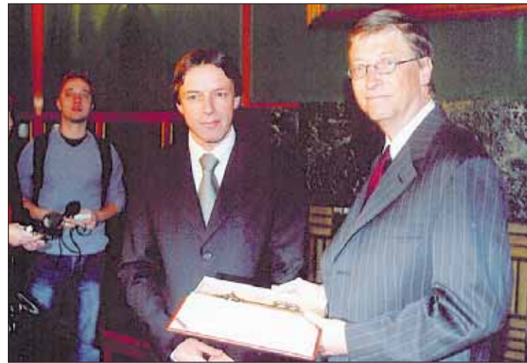
Bill Gates – osobnost moderních informačních technologií – převzal od MUDr. Pavla Béma, primátora Prahy, klíč k hlavnímu městu.

humanitární program určený obyvatelům zemí východní Evropy nazvaný Potenciál bez hranic, jehož cílem je naučit jakkoliv handicapované lidi základním dovednostem při práci s výpočetní technikou. Tato iniciativa je především zaměřena na podporu lokálních charitativních programů. (ist)