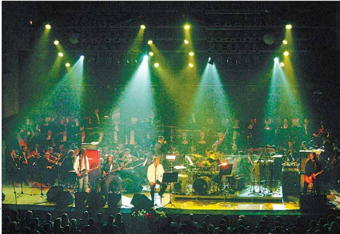
Na konci ledna diváci aplaudovali společnému koncertu skupiny Lucie a Symfonického orchestru hlavního města Prahy FOK.