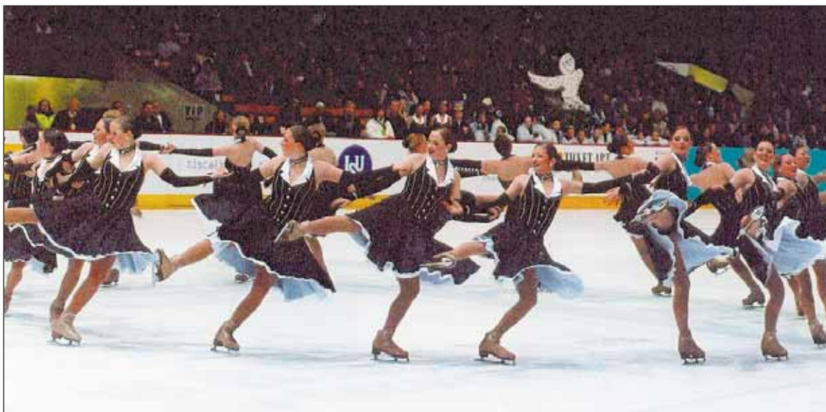
Divácky atraktivní soutěž v synchronizovaném bruslení Prague Cup proběhla na přelomu ledna a února v T-Mobile Aréně.

Divácky velmi atraktivní záležitostí byl IV. Mezinárodní závod v synchronizovaném bruslení Prague Cup, který se uskutečnil na přelomu ledna a února v pražské T-Mobile Aréně.