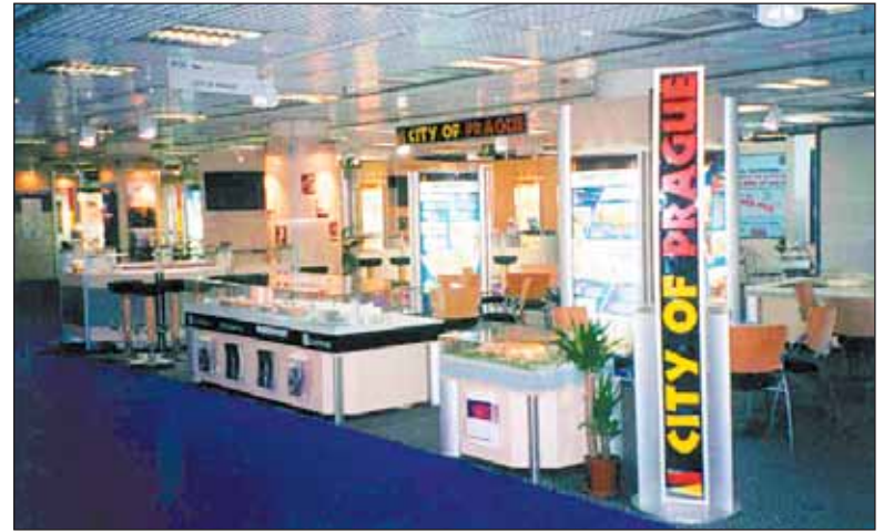
Prezentační stánek Prahy byl i na loňském ročníku veletrhu MIPIM.

V loňském roce se na 17 tisících m 2 výstavní plochy veletrhu MIPIM představilo více než 14 tisíc účastníků z 62 zemí.