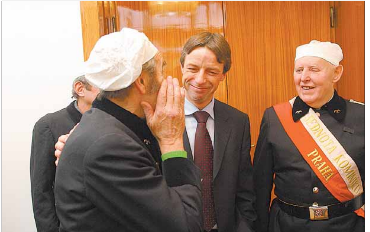
MUDr. Pavel Bém, primátor Prahy, přijal na začátku ledna zástupce některých cechů – jedním z nich byla i Jednota kominíků v Praze.

Novoroční přání řemeslníků a živnostníků svým zákazníkům a také představitelům veřejného života patří v českém prostředí k nejmladší vrstvě zvyků a její počátky nenalezneme dříve než v druhé polovině 19. století. Velmi staré kořeny má naopak oslava Vánoc a dalších církevních svátků včetně účasti na slavnostech, procesích a poutích, které