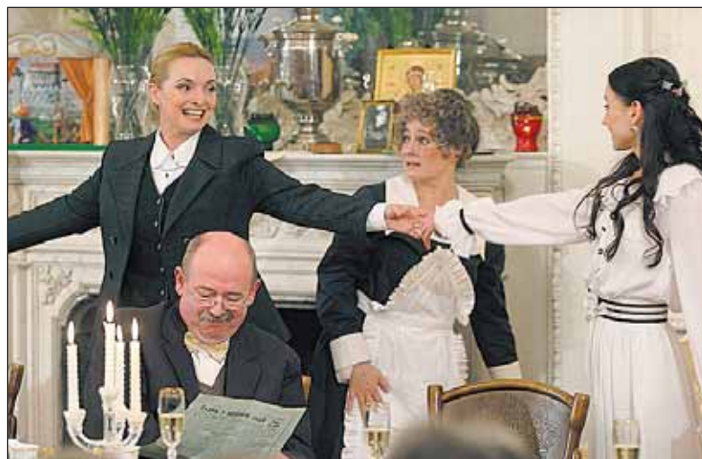
Cenami ověnčenou hru Tri sestry divadla A. Bágara z Nitry mohli diváci zhlédnout v Clam-Gallasově paláci.