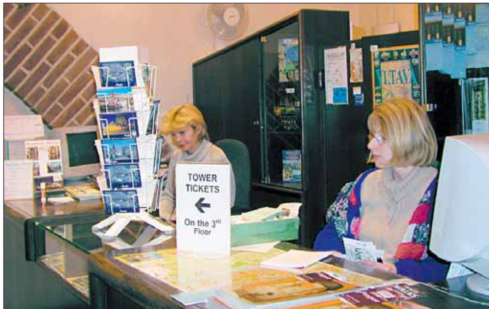
Pražská informační služba se může pochlubit čtyřmi informačními středisky, kde je dobře vyškolený personál, který poskytne rady a informace z celé řady oblastí týkajících se Prahy.

PIS má čtyři informační střediska: na Staroměstské radnici, Hlavním nádraží, Na Příkopě a během sezóny i v Malostranské mostecké věži Karlova mostu. Může zprostředkovat i ubytování pro vaše známé či obchodní partnery, předprodej vstupenek na kulturní akce atd.