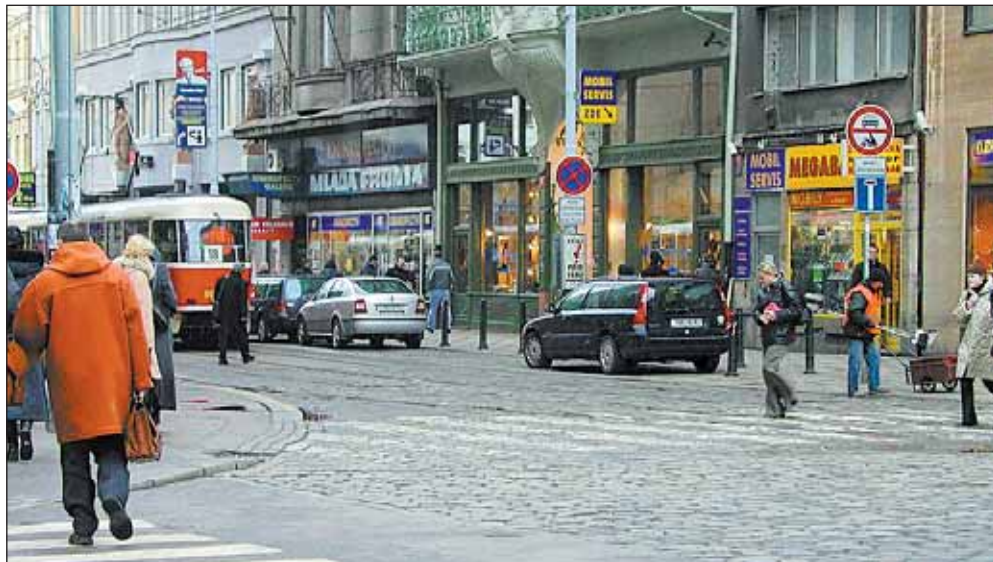
Křižovatka ulice Spálená a Národní třídy by měla být od 15. dubna do 20. května uzavřena z důvodu opravy tramvajové tratě.

„Z letošních požadovaných uzavírek, které budou mít větší vliv na plynulost dopravy bychom měli jmenovat především Chotkovu ulici,“ říká inženýr Malý. „Na ní se má rekonstruovat vozovka, takže ulice bude uzavřena pro veškerou dopravu. Pokud