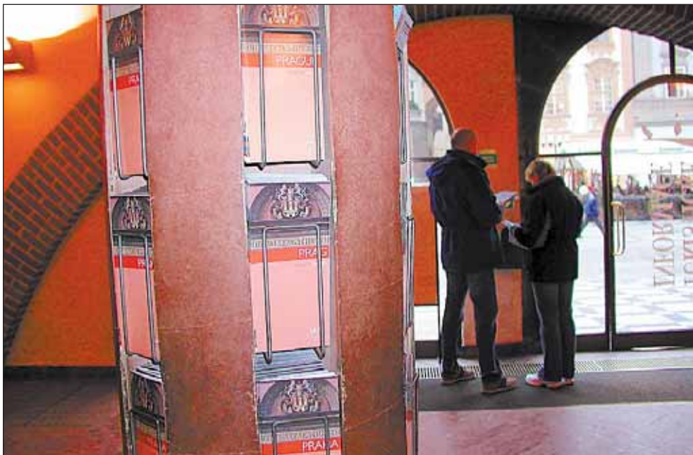
Středisko Pražské informační služby se nachází také na Staroměstské radnici.

Například ubytování, vstupenky na kulturní pořady, Přehled kulturních pořadů v Praze v českém, anglickém a německém jazyce, okružní jízdy Prahou (pěšky, autobusem, lodí, s různými tématy), výlety mimo Prahu, turistickou literaturu a mapy, jízdenky na městskou hromadnou dopravu.