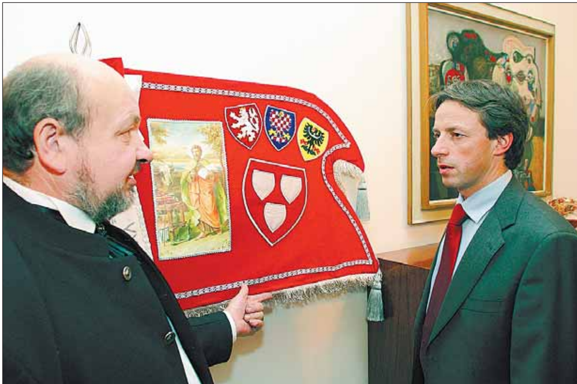
Primátor města se také setkal se zástupci Cechu malířů a lakýrníků.

Kominíci Malíři Zedníci Pekaři Plavci Řezníci Ševci