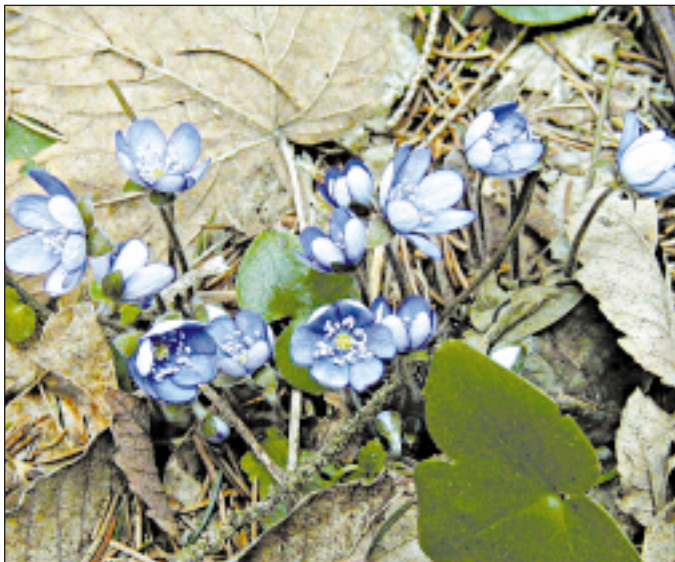
Fialové podléšky, bílé sasanky či orseje – jarní ozdoby Prahy

musíte trefit správný čas. Nedá se přesně říci, kdy které z našich kráskek pokvetou, obvykle to bývá v první polovině dubna. Takže je nejvyšší čas – a za pokus to rozhodně stojí. Třeba i někdy. (cyk)