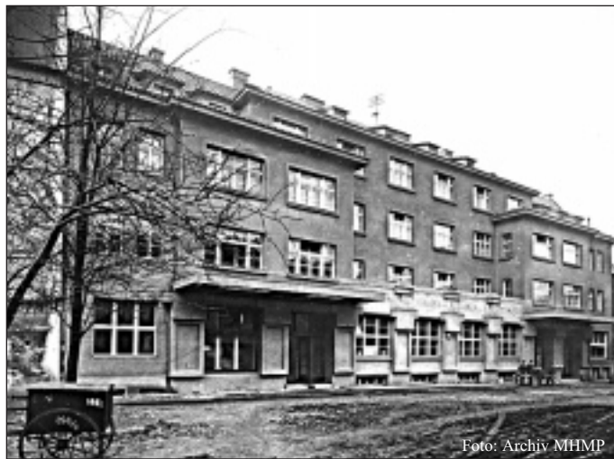
Pohled na budovu Umělecké besedy v Besední ulici kolem roku 1930

i ke Křovákům na poušť Kalahari. Odpovídala estetickému názoru a pocitu tehdejší přechodné doby mezi poetismem a surrealismem, který s obdivuhodnou původností a plnokrevností vystihl autoři re-