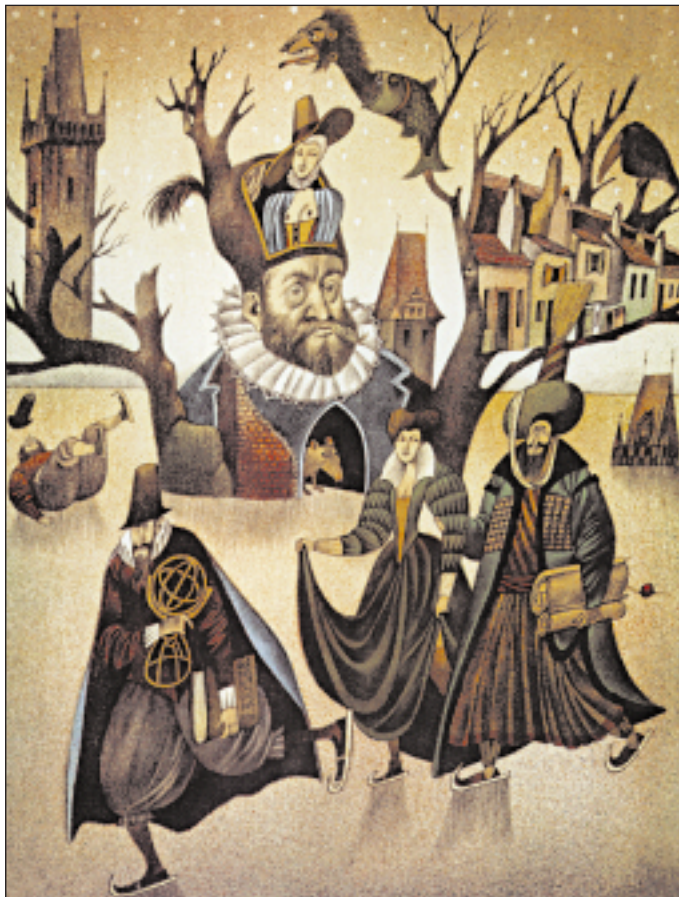
Audience u císaře Rudolfa. Litografie

To je jinak. Já jsem buď velmi spokojený, nebo velmi nespokojený. Nespokojený jsem, když třeba musím zažívat, jak se vytrácí slušnost – a to z naprosto základních věcí. Že už se třeba nezdraví, když se vejde do krámu. Já jsem na to citlivý a hodně mi to chybí. Ale spokojený jsem proto, že si můžu koupit pro svoji práci materiál, který chci, určitý druh papíru, určitý druh štětce, barev. Že kdokoli má tuto možnost. To bude pro nás, kteří si ještě něco pamatujeme, vždycky takový zážrak. (q)