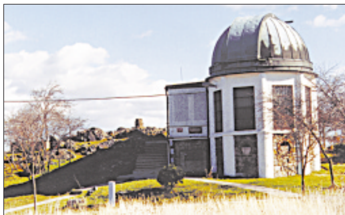
Ďáblická hvězdárna – tip na jarní výlet

V popředí před námi se rozkládá přívítivá středoečeská krajina, pozvolně se svažující k Labi. Přímou v severním směru se nad ní zvedá Mělník. Poněkud západněji je vel-