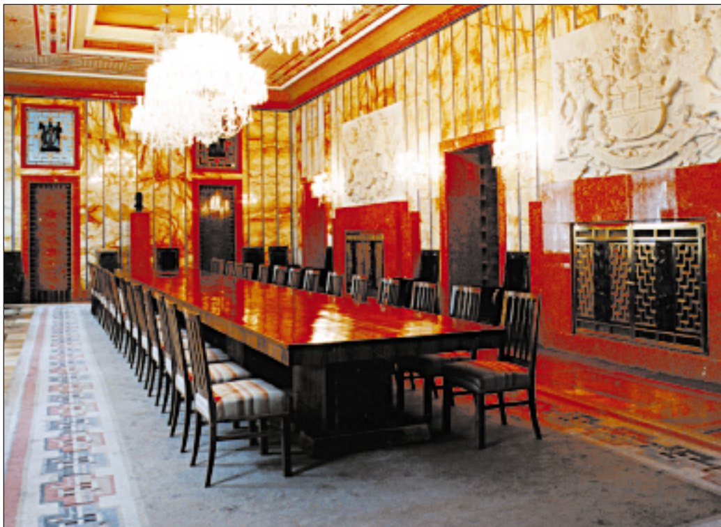
Budete si moci prohlédnout i jindy nepřístupný recepční salon v rezidenci primátora.

V prvním návštěvním dni budou pro zájemce otevřeny dveře všech kanceláří. Dále si mohou prohlédnout prostory v Městské knihovně a v Muzeu hl. m. Prahy, které jindy přístupné nejsou. V sobotu 18. května budou otevřeny všechny reprezentační prostory v historických budovách (např. Brožíkův sál, Stará rada, Jiříkův sál na Staroměstské radnici, Mramorový sál v Clam-Galla-