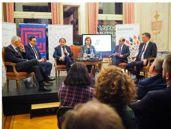
Evropské dialogy Václava Havla