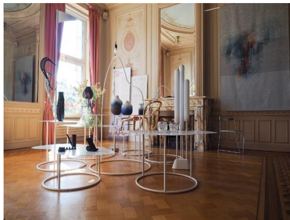
Výstava Design & Transformace ve spolupráci s UMPRUM