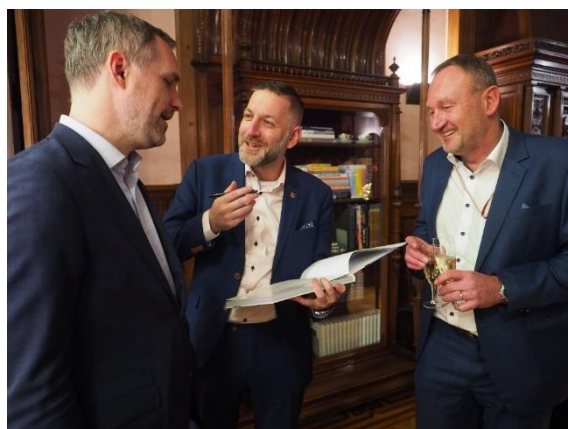
Setkání České národní delegace při Výboru regionů