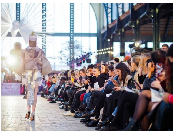
Módní přehlídka ve spolupráci s Českým centrem v Gare Maritime