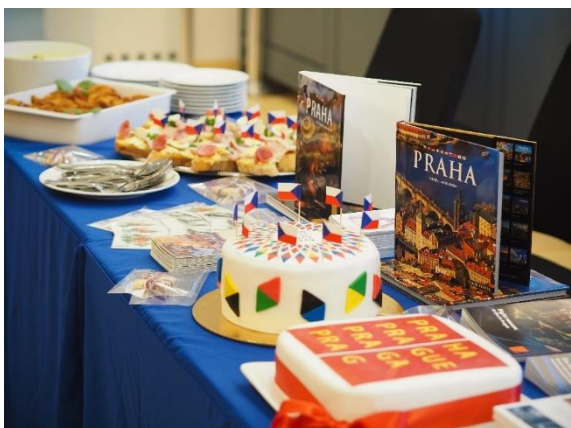
Prezentace českých regionů ve Výboru regionů u příležitosti Předsednictví ČR Radě EU