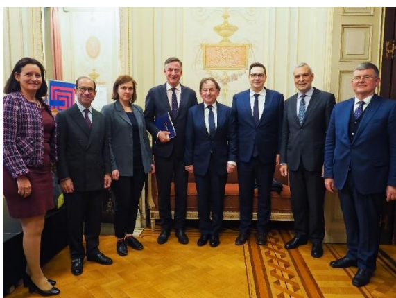
Evropské dialogy Václava Havla