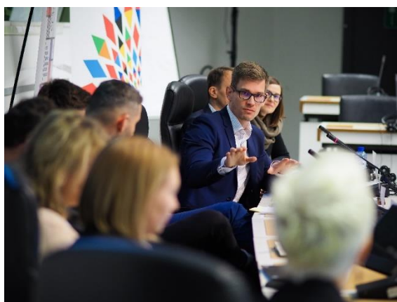
Konference Inovační rozmanitost v českých regionech