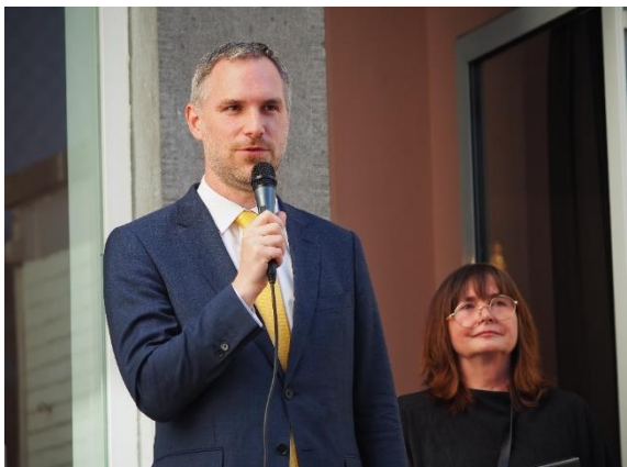
Slavnostní zahájení výstavy „Mentální prostor, mentální krajina“ primátorem Zdeňkem Hřibem