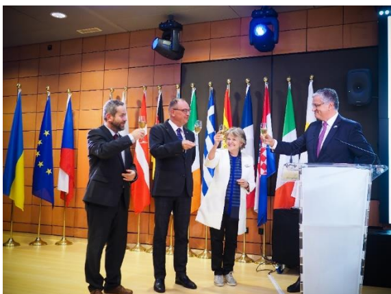
Prezentace českých regionů na půdě Výboru regionů