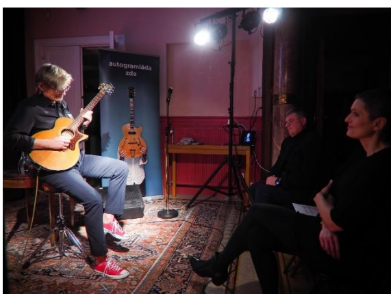
Koncert Rudyho Linky