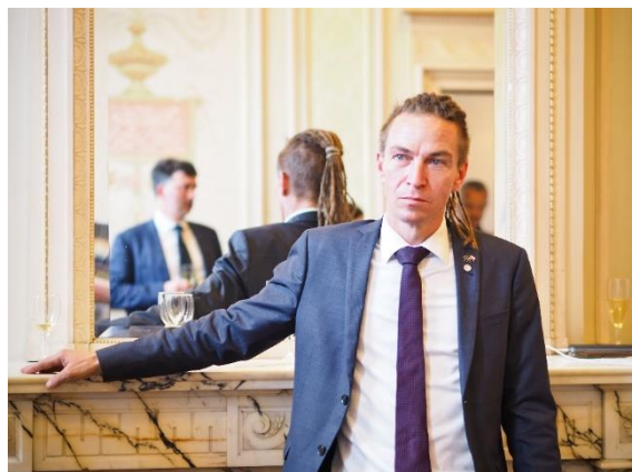
Setkání České národní delegace ve Výboru regionů s ministrem pro místní rozvoj