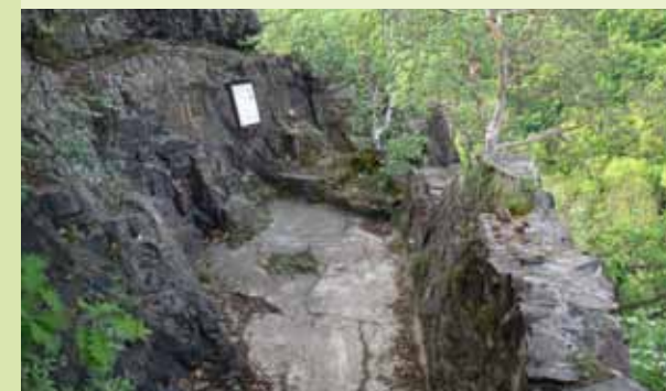
Zastávka naučné stezky

PŘÍSTUP: Keltská stezka je koncipována jako průchozí s možností přístupu z několika míst: – Od autobusové zastávky Závist (nebo Nádraží Zbraslav) linky č. 165 – Od autobusové zastávky Točná linky č. 173 (odtud ulicí Na stráňkách, na jejím konci je úvodní tabule) – Z parkoviště od zookoutku Lesního závodu Konopiště a u restaurace U Chladů na Závisti