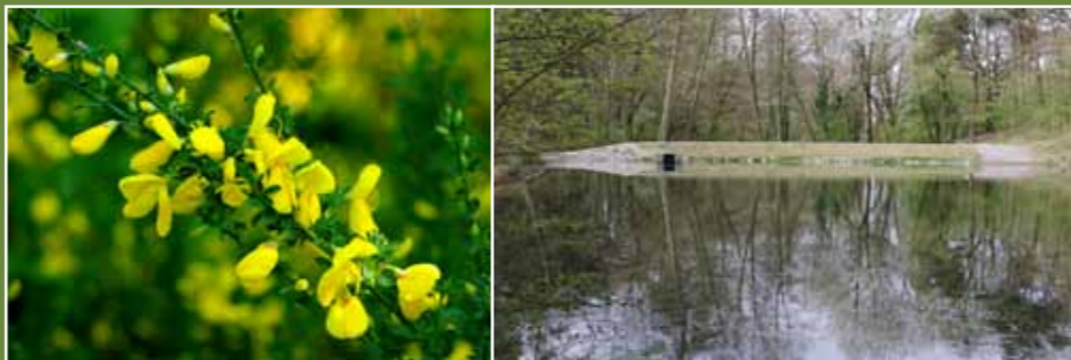
V lese roste zdomácnělý žanovec metlatý

Červeně je vyznačena hranice současného lesa v majetku hl. m. Prahy. Z mapy je patrné, že na území se lesy nacházely i historicky, naopak nezanedbatelná část původně lesních ploch je nyní zastavěna.