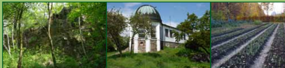
Přírodní památka Ládví