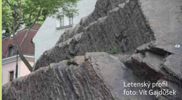
Letenský profil